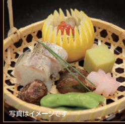
写真はイメージです