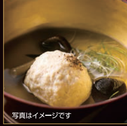
写真はイメージです