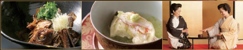
写真はイメージです

宴こよみ 10,000円 昼・夜：6名様より ※6名様毎にコンパニオン1名2時間付