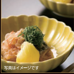
写真はイメージです